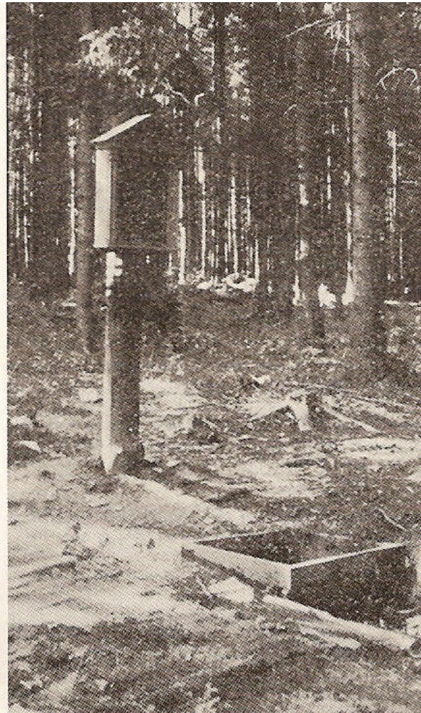
Die obere Oderquelle im Jahr 1936

Im „Großen Deutschlandbuch“, Ausgabe 1964, ja sogar in der Enzyklopädie meines Computers, Ausgabe 2004, ist die Angabe über den Oderursprung falsch.