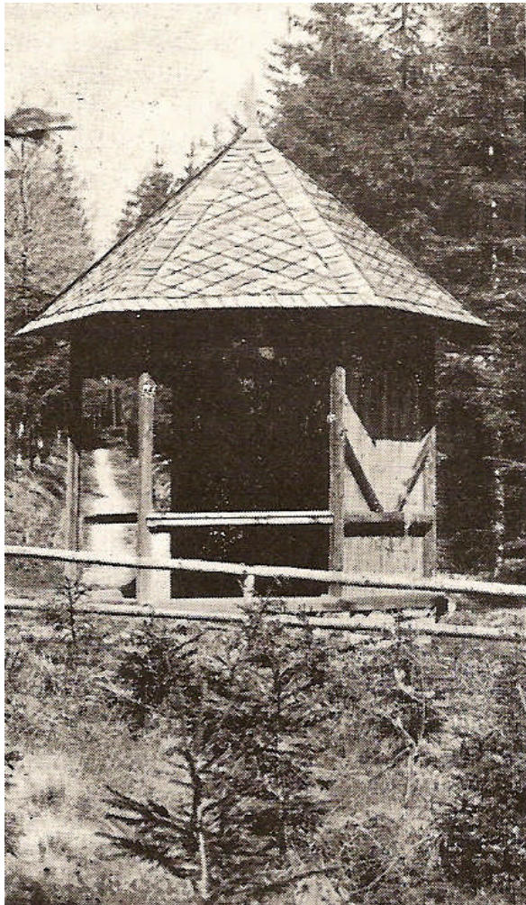
Die untere Oderquelle

Die durchfließende junge Oder prägt Landschaft und Leute. Sie entspringt in der Einsattelung zwischen dem Friedelhübel (681m) und dem Kreuzberg (653m) bei den beiden deutschen Gesenkdörfern Haslich und Koslau (Bodenstadt) im Revier „beim schönen Ort“ in Mähren. Rolleder und Joksch schreiben beide über die vielen falschen Angaben zum Oderursprung und dass es 2 dicht beieinander liegende Quellen gibt.