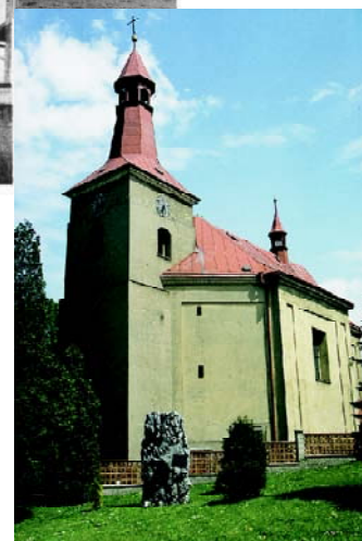
Die jetzige St. Georgs-Pfarrkirche wurde 1757 eingeweiht