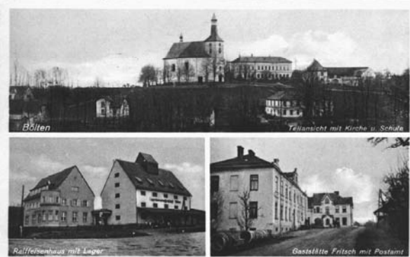
Alte Grußkarte, auf dem Kirchhübel (306 m) stehen Kirche, Schule und Pfarrhaus