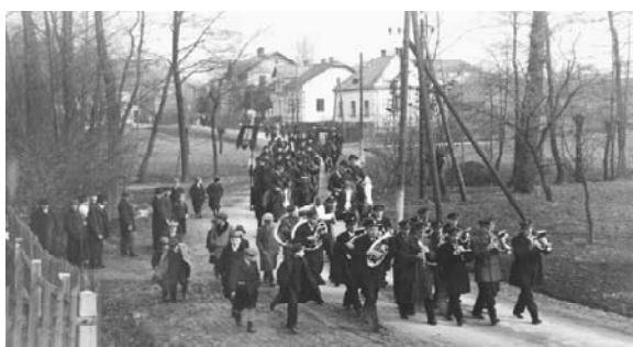
Saatreiterzug im Oberdorf, 1934