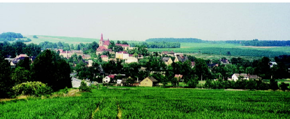
Blick vom Hirschberg auf den mittleren Teil von Böldten mit dem Kirchhübel