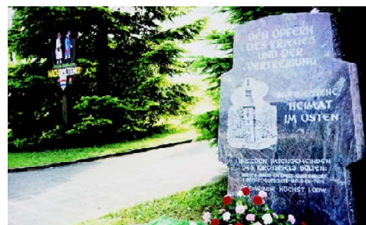
Vor der Christ-König-Kirche in Höchst /Odenw., ein holzgeschnitztes Heimatrelief, gegenüber wurde 1987 ein Gedenkstein „Den Opfern des Krieges und der Vertreibung“ errichtet (beides Widmungen der Gemeinde Höchst für die Patengemeinden des Kirchspiels Böldten)