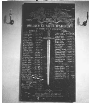
Die 1922 angefertigte Marmortafel zum Gedenken der Gefallenen des I. Weltkrieges