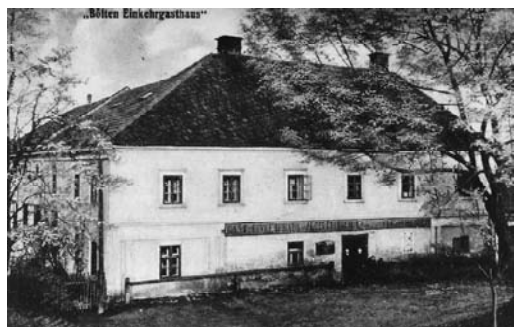
Einkeergasthaus mit Fleischhauerei um 1925 (früher Alois Fritsch, 213)