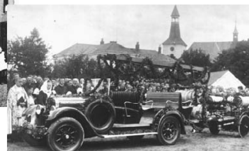
Einweihung der 1935 neu angeschafften Motorspritze