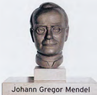
Johann Gregor Mendel

Johann Gregor Mendel, Begründer der Vererbungslehre (geb. 1822 in Heinzendorf - gest. 1884 in Brünn) und Dr. Sigmund Freud Begründer der Psychoanalyse (geb. 1856 in Freiberg - gest. 1939 in London).