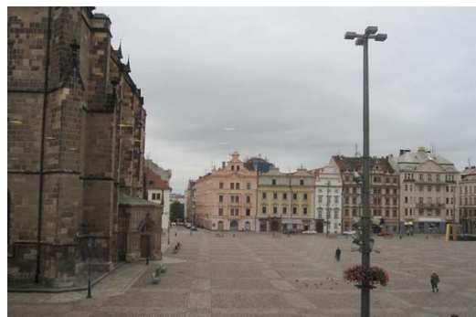
Stadtplatz in Pilsen

Was für andere ein Besuch in einem Museum, wo man von Raum zu Raum wandelt und alte Gemälde bewundert, war für uns diese Kulturreise in unsere Heimat, ein „Museumsbesuch in anderen Dimensionen“. Unser Autobus steuerte am nächsten Tag das zweite Reiseziel an. Das Kloster Raigern/ Rajhrad bei Brünn. Die Fassade der Klosterkirche strahlte leuchtend gelb im Wettstreit mit der Sonne. Eine Führung durch die Museumsräume die der „Buchdruck-Kunst“ gewidmet sind,