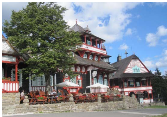
Holzhäuser auf der Pustevny

Nach einem guten Mittagessen, gestiftet von der Firma, wurden wir entführt in das „Reich des Radegast“. Noch einmal konnten wir die Schönheiten der Landschaft genießen. Bei herrlichem Sonnenschein erreichten wir in geschwungenen Serpentina den Parkplatz auf der „Pustevny“. Ein schöner Ausflugsort in den Beskiden. Nach kurzer Wanderung sieht man dann schon die prächtigen Holzhäuser. Kunstvolle Bauten aus Naturholz gezimmert und außen wie innen mit geschnitzten Ornamenten farbig verziert. Eine Augenweide unter blauem Himmel. Zum Abschluss dieses schönen Tages machten wir noch einen Besuch auf dem Friedhof in Gurtendorf. Stellvertretend für alle unsere Ahnen und Vorfahren, die in der „Heimaterde Kuhländchen“ ruhen, zündeten wir eine Kerze an. Das Licht leuchte ihnen bis in alle