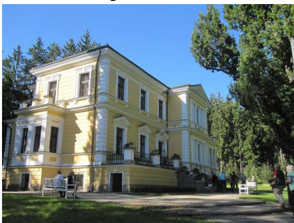
Antonin Dvorak Gedächtnisstätte