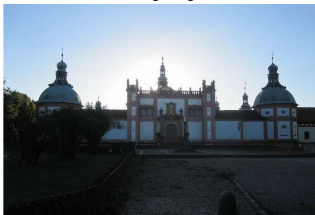
Kloster „Svata Hora“ Hl. Maria bei Pribram