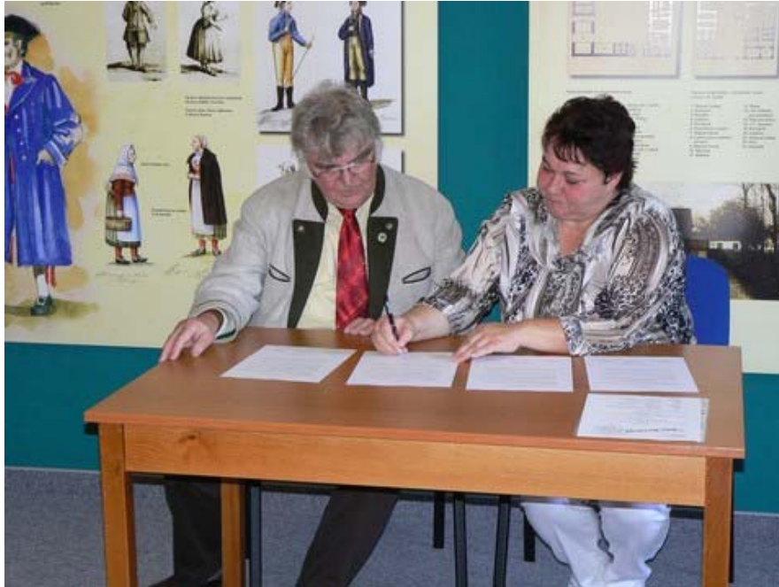
Unterzeichnung des Leihvertrages