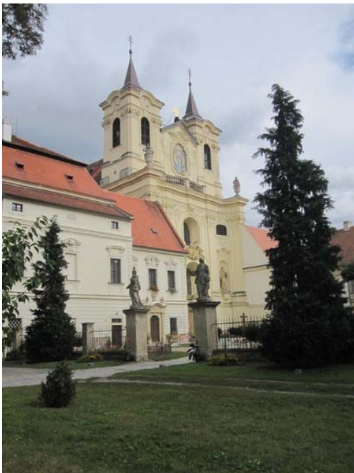
Kloster Rajhrad/ Raigern