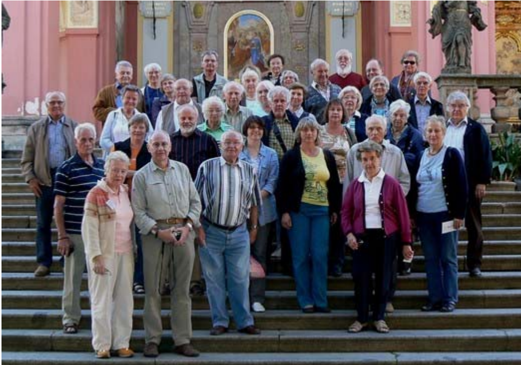
Die Reisegruppe Kuhländchen