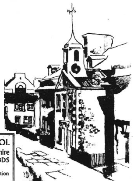
Fulneck Moravian Church (1748) Pudsey, West Yorkshire